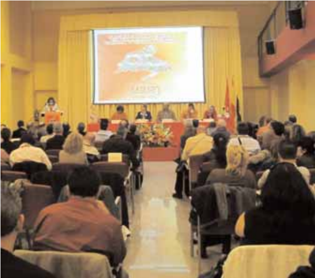
Vista de los asistentes al VII Congreso