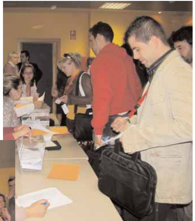
Instantáneas de las votaciones por parte de los delegados a la nueva Comisión Ejecutiva Regional de USO -Madrid, en el Centro Polivalente "Abogados de Atocha" de Torrejón de Ardoz.

Tras esto se cerró el turno de presentación de candidaturas y se procedió a las votaciones de los candidatos.