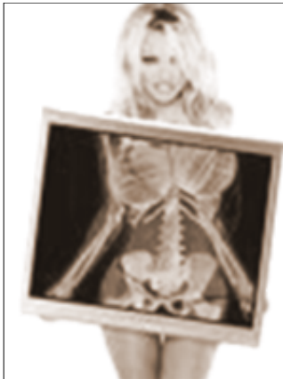
Nos quieren dejar en los Huesos

“SE INCREMENTAN LOS IMPAGOS, LOS RECORTES DE PLANTILLAS, LA ELIMINACIÓN DE PLUSES Y LOS DESCUELGUES SALARIALES “