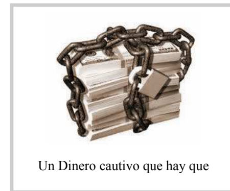
Un Dinero cautivo que hay que

ble que, cuando el trabajador, o la empresa no estén conformes con las cantidades que se cuestionen en los juicios y no haya posibilidad de acuerdo extrajudicial, tanto unos como otros, recurrirán las sentencias y el tema seguirá quedando abierto a lo que pueda decidirse en la siguiente estación de este tortuoso recorrido judicial: las Salas de lo Social de los Tribunales Superiores de Justicia.