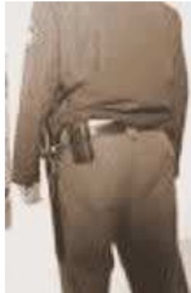
Vigilante de Seguridad de Vuelta

temente, se ha presentado en el sector, de otra forma y con otro ritmo aun así, los trabajadores de seguridad, ya hemos pagado la parte que nos corresponde de esta crisis y ya hemos hecho el esfuerzo que, se supone han hecho, o tienen que hacer, los trabajadores de otros sectores.