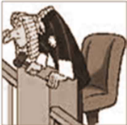
¿Una Sentencia Definitiva?

P arecía que con la última sentencia del Tribunal Supremo del mes de mayo de 2011, iban a finalizar todos los conflictos abiertos desde que este mismo Tribunal dictara aquella sentencia, en la que anulaba el artículo 42 del convenio en el que por entonces, se fijaba un precio único por cada hora extraordinaria y para cada categoría