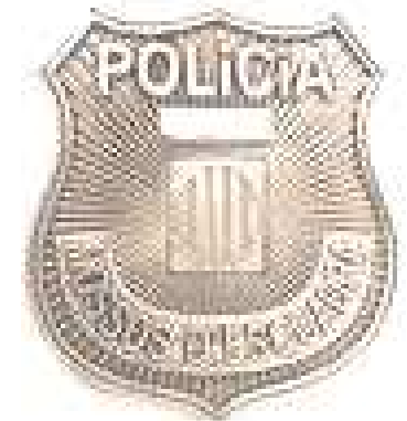
Agente de la Autoridad en Cataluña

De acuerdo con las atribuciones de coordinación de los servicios de seguridad privada de la policía de las instituciones propias de Cataluña que son competencia de la Generalitat, el personal de seguridad privada, cuando preste servicio para garantizar la seguridad en las infraestructuras y los servicios de transporte público de Cataluña por cuenta de la Administración o entidades del sector público o empresas operadoras, siempre que el desarrollo de las funciones derivadas del servicio contratado de conformidad con la legislación de contratación pública, se considera que tiene la condición de agente de la autoridad colaborador de los cuerpos policiales de Cataluña.”