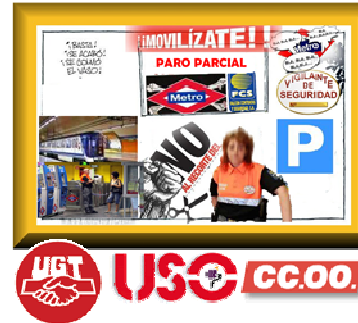
Movilización en Falcón Metro de Madrid contra el recorte salarial

Cuando este Boletín este publicado, seguramente que habrá novedades sobre el conflicto que se esta dando entre las empresas de seguridad que prestan servicio en METRO de Madrid y sus Vigilantes.