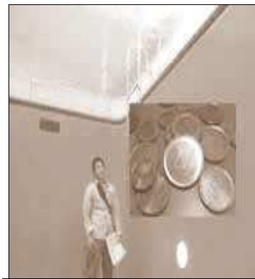
Sacar la economía del Fondo de la Piscina

Con tantas horas extras, tanta retribución en dietas y con tantos conceptos salariales, fuera de convenio, como existen en el sector de seguridad privada, la práctica del pago en “B”, en “negro”, o “fuera de nómina”, de cantidades que corresponden a conceptos salariales claramente cotizables y tributables, hasta ahora, ha sido una práctica muy típica y abundante en esta actividad.