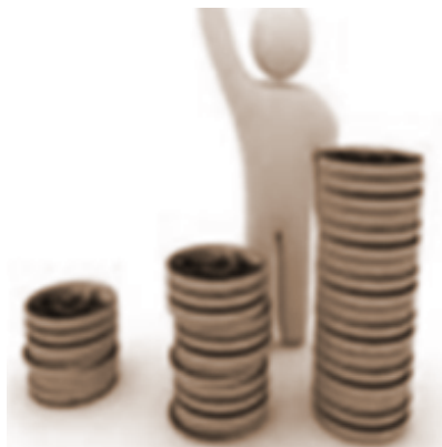
No Mas recortes Salariales en las Empresas de Seguridad

S i tenemos que creernos los datos de los últimos años sobre la evolución del crecimiento del sector, datos que provienen siempre de sospechosos estudios que pagan la patronal más importante del sector de seguridad, podemos comprobar que, por los efectos de la crisis, se ha reducido la facturación y el movimiento económico, en los últimos años.